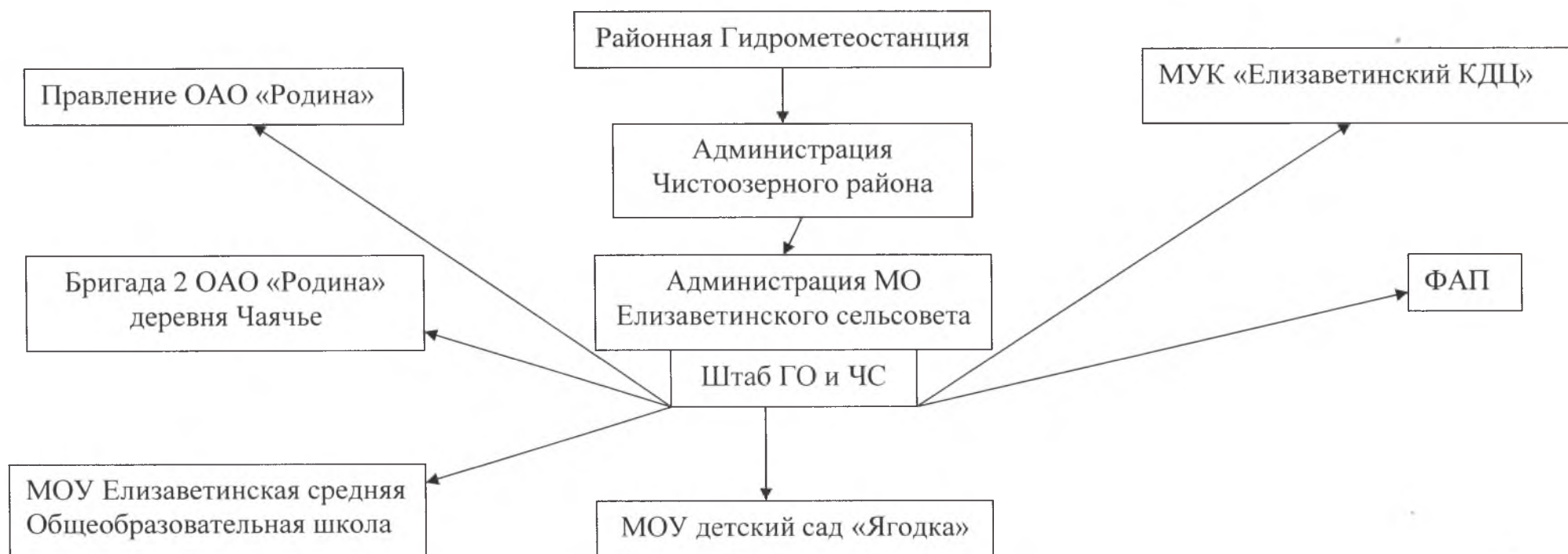
СХЕМА ОПОВЕЩЕНИЯ при штормовом предупреждении и возникновении чрезвычайных ситуаций